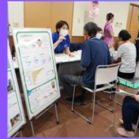
西尾市げんき プラザ