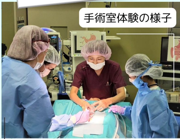
手術室体験の様子