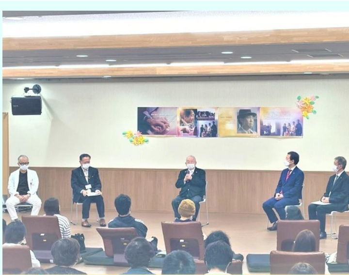
映画上映「ディア・ファミリー」 & トークイベントの様子