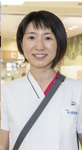
皮膚排泄ケア 認定看護師