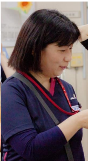
感染管理看護 認定看護師