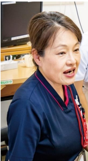
摂食・嚥下障害 認定看護師