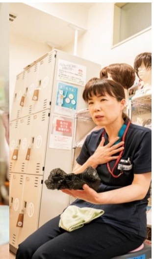
がん化学療法看護 認定看護師

市民病院 事務部 管理課 職員担当 0563 - 56 - 3171（内線2286）