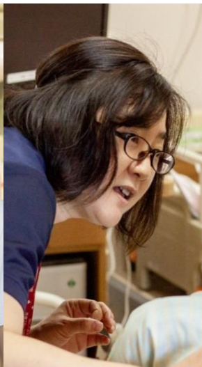
認知症看護 認定看護師