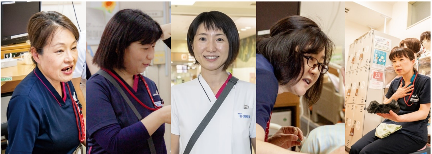
摂食・嚥下障害 認定看護師