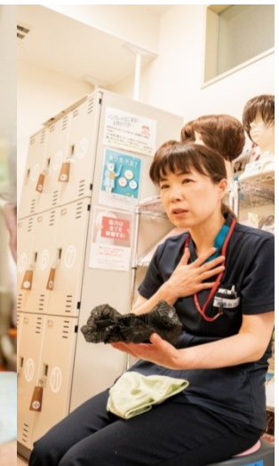
がん化学療法看護 認定看護師