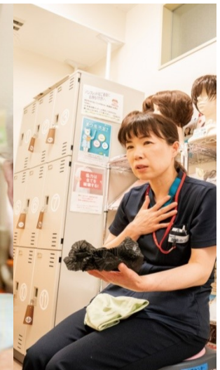
がん化学療法看護 認定看護師