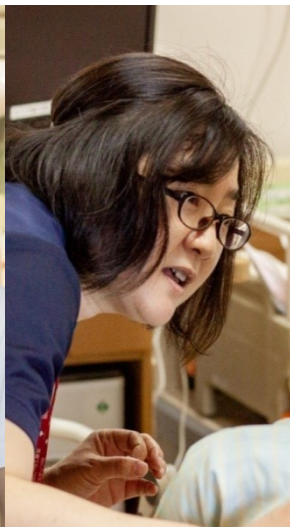
認知症看護 認定看護師