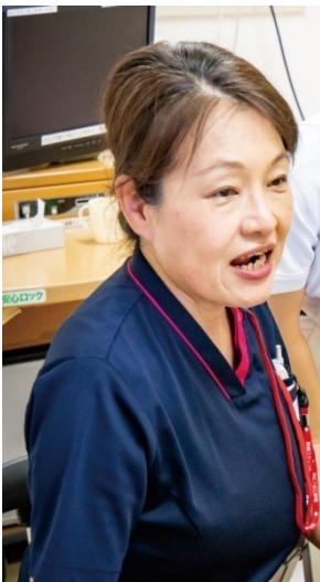
摂食・嚥下障害 認定看護師